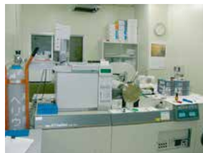
高分解能 GC-MS 分析装置