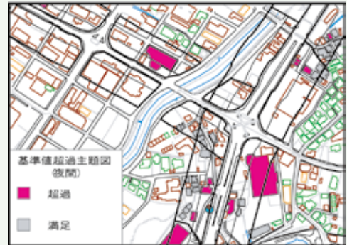
道路交通騒音の面的評価