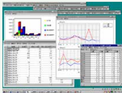
環境データベース

アプリケーション開発 ・図表等作成 ・大気質予測プログラム ・騒音・振動予測プログラム ホームページ作成・運用